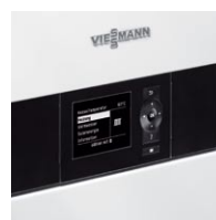
Nowy, sterowany pogodowo, regulator kotła Vitotronic typ HO1A