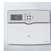
Vitosolic 200, typ SD4 – inteligentny regulator instalacji solarnej

Vitosol 200-T zapewnia możliwość uniwersalnego zastosowania na wszystkich rodzajach dachów i elewacji.