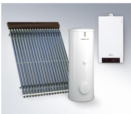
Dostępny w atrakcyjnych cenowo pakietach solarnych z bivalentnymi podgrzewaczami ciepłej wody użytkowej Vitocell (od 300 do 500 l).