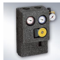
Zespół pompowy Solar-Divicon odpowiada za hydraulikę w systemie grzewczym